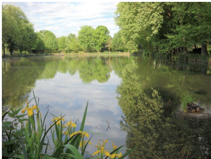
Dénicher un petit coin tranquille en pleine nature, à quelques minutes de marche seulement

solu, le silence protecteur évoqué plus haut, laisse quand même par instants parvenir à nos oreilles un léger bruissement de l'air caressant des feuillages verdoyants. Feuillages à l'ombre desquels, par moments, des oiseaux échantent en chantant de brefs et mystérieux propos.