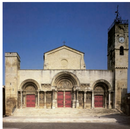
L'église Saint-Gilles où mènent les Chemins.

La thématique " Le patrimoine du XXI e siècle, une histoire d'avenir " propose de présenter au public le processus de " patrimonialisation " considéré sous l'angle d'un continuum historique.