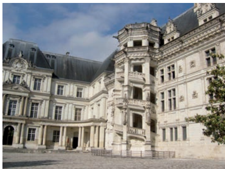
François I er séjourna souvent au château de Blois.